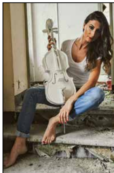
Il violino è quell'archetto che ci fa pulsare l'anima e ci fa profumare la vita, per non farci sentire il silenzio che ci circonda.

Miglior occasione per ammirare le varie opere d'arte, particolari anche nella loro esposizione.