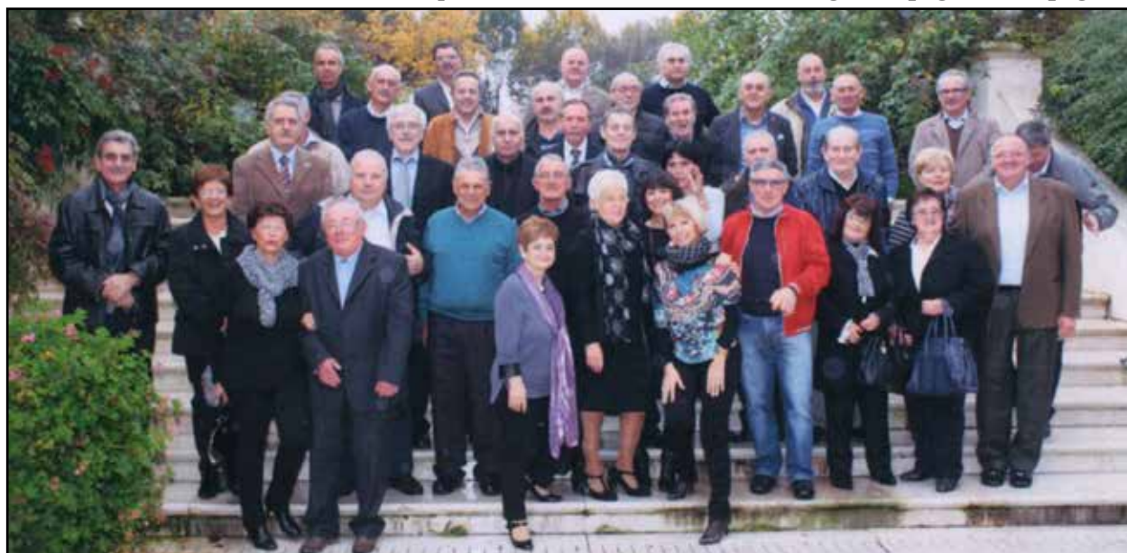
Festa della classe 1949 nell'anno 2014.

Oltre ai coetanei è gradita anche la partecipazione di coniugi, campagne e compagni.