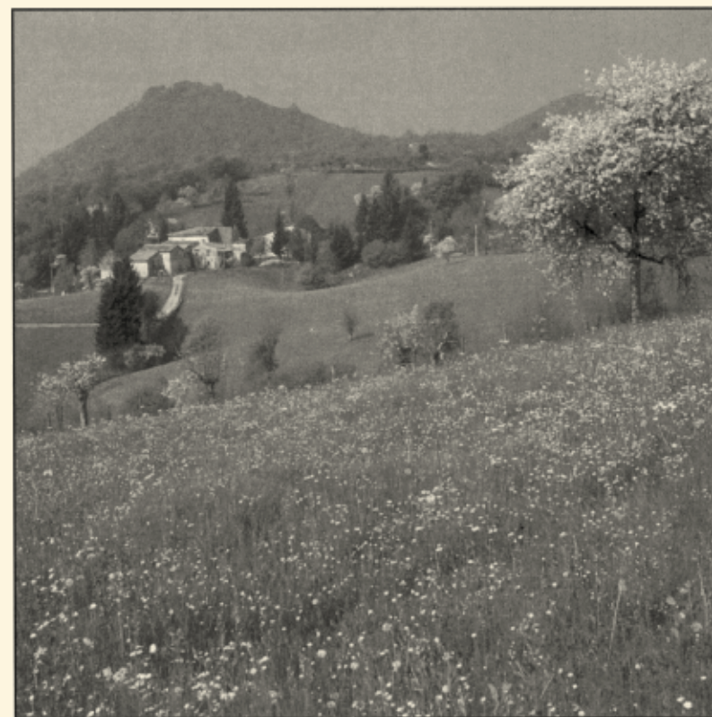
Altupiano di Cariadeghe - Riserva naturale.

carezza sul corpo: le dita scivolano via tanto è umido.