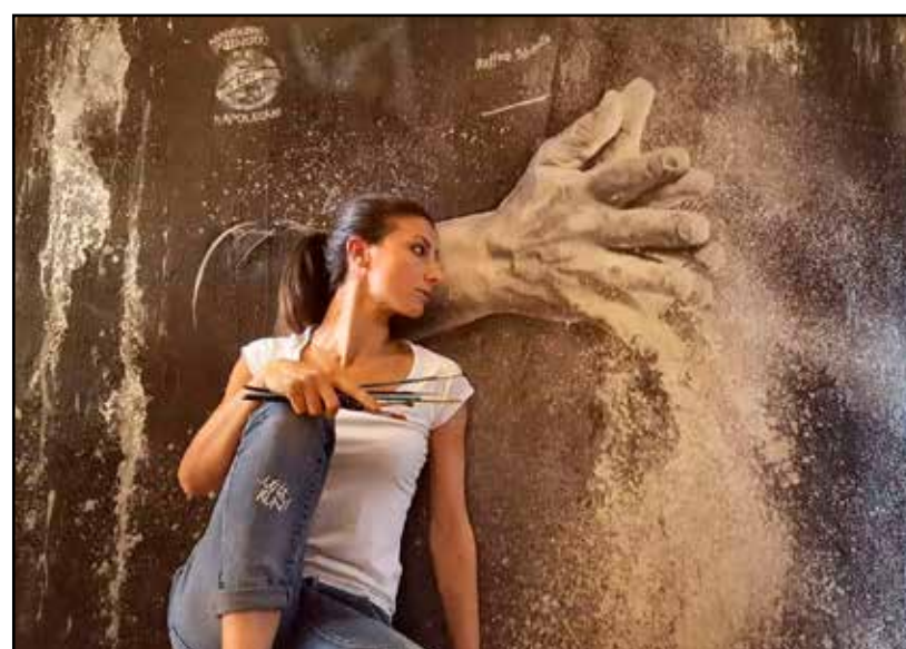
L'artista in simbiosi con la sua opera d'arte.