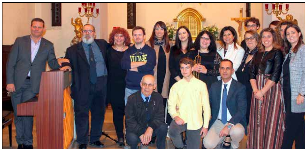
Gli organizzatori della riuscita manifestazione.

Montichiari: colazione di solidarietà per il Dopo di Noi Domenica 10 novembre a Villa Mazzucchelli presso i Padri di Borgosotto