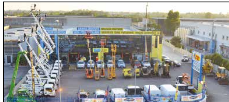
La nuova sede della Noleggio Lorini in zona industriale, via E. Montale 15.

SEDE: MONTICHIARI (BS) - Via E. Montale, 15 FILIALI: CALCINATO - CASTEGNATO tel. 030.9650556 - www.noleggiolorini.com