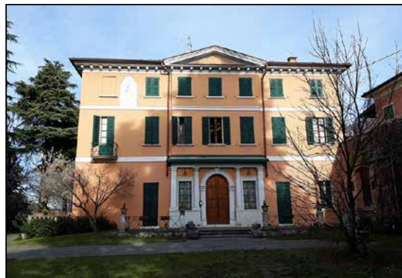
Palazzo Mazzucchelli in Borgosotto.

Montichiari: colazione di solidarietà per il Dopo di Noi Domenica 10 novembre a Villa Mazzucchelli presso i Padri di Borgosotto